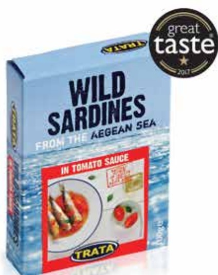
Sardines in tomato sauce Sardinen in Tomatensoße Sardines à la sauce tomate