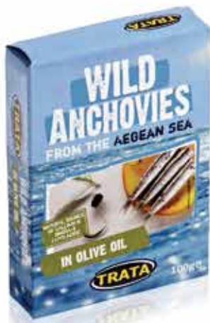
Anchovies in olive oil Sardellen in Olivenöl Anchois à l'huile d'olive