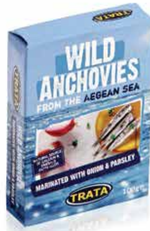
Anchovies marinated with onion and parsley Marinierte Sardellen mit Zwiebel und Petersilie Anchois marinés à l'onion et au persil