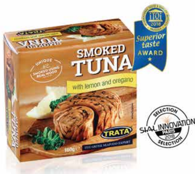
Smoked tuna with lemon and oregano Geräuchertes Thunfisch mit Zitrone und Oregano Thon fumé au citron et à l'origan