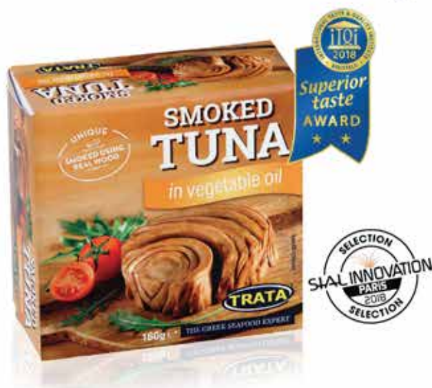
Smoked tuna Geräuchertes Thunfisch Thon fumé