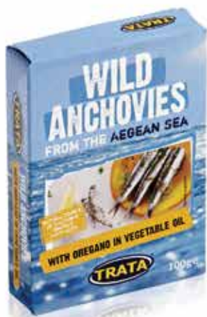
Anchovies with oregano in vegetable oil Sardellen mit Oregano in Pflanzenöl Anchois à l'huile végétale et origan