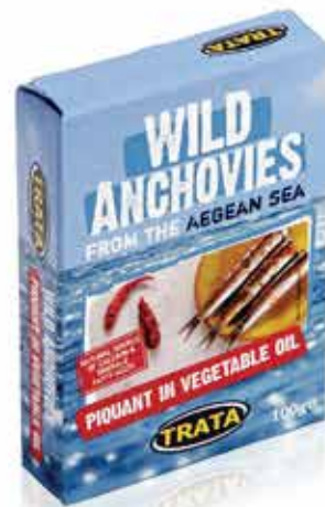
Anchovies piquant in vegetable oil Scharfe Sardellen in Pflanzenöl Anchois à l'huile végétale piquants