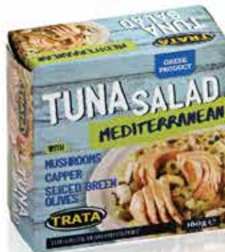
Tuna salad Mediterranean Mediterranerer Thunfischsalat Salade de thon méditerranéenne