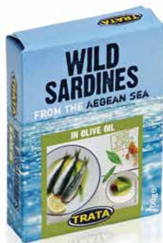
Sardines in olive oil Sardinen in Olivenöl Sardines à l'huile d'olive