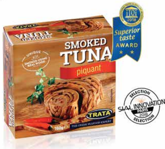
Smoked tuna piquant Geräuchertes Thunfisch pikant Thon fumé piquant