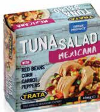
Tuna salad Mexicana Thunfischsalat à la Mexicana Salade de thon Méxicaine