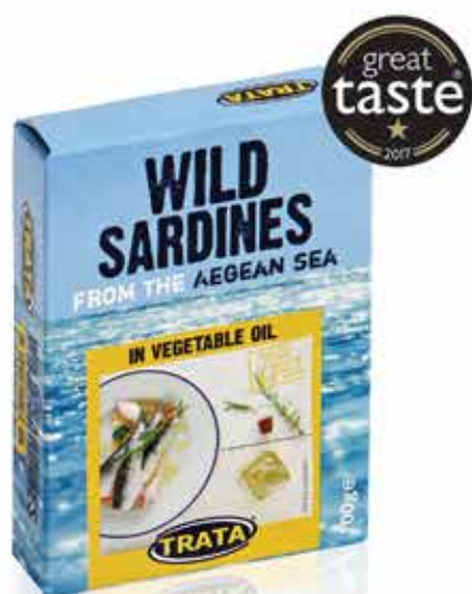
Sardines in vegetable oil Sardinen in Pflanzenöl Sardines à l'huile végétale