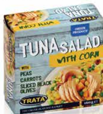
Tuna salad with corn Thunfischsalat mit Mais Salade de thon au maïs