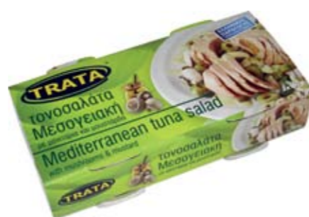
Τονοσαλάτα μεσογειακή με μανιτάρια και μουστάρδα Mediterranean tuna salad with mushrooms and mustard