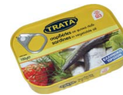
Σαρδέλες σε φυτικό λάδι Sardines in vegetable oil