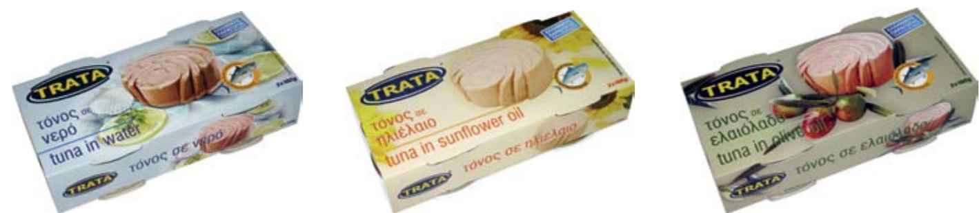
Τόνος σε νερό Tuna in water