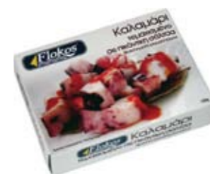
Καλαμάρι τεμαχισμένο σε πικάντικη σάλτσα Sliced squid in piquant sauce