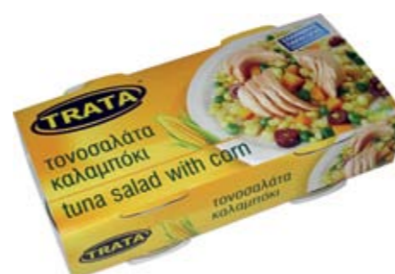
Τονοσαλάτα καλαμπόκι Tuna salad with corn