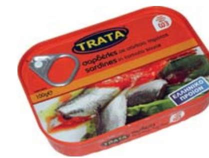
Σαρδέλες σε σάλτσα τομάτας Sardines in tomato sauce