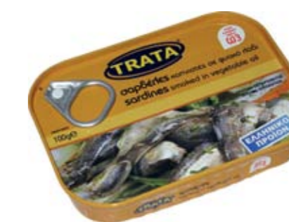
Σαρδέλες καπνιστές σε φυτικό λάδι Sardines smoked in vegetable oil