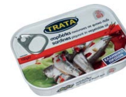
Σαρδέλες πικάντικες σε φυτικό λάδι Sardines piquant in vegetable oil