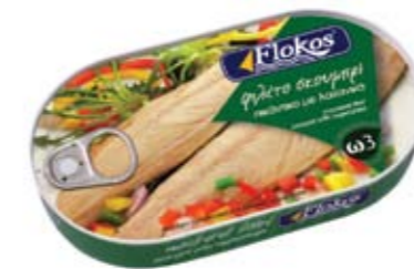
Φιλέτο σκουμπρι πικάντικο με λαχανικά Mackerel fillet piquant with vegetables