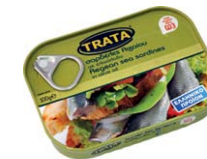
Σαρδέλες σε ελαιόλαδο Sardines in olive oil