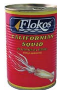
Καλαμάρι Καλιφόρνιας σε φυσικό κυνό California squid in natural brine