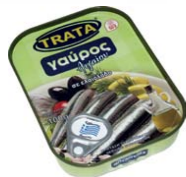
Γαύρος σε ελαιόλαδο Anchovy in olive oil