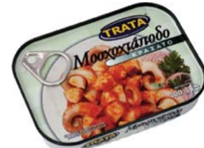
Μοσχοχτάποδο κραάτο Musky octopus in wine