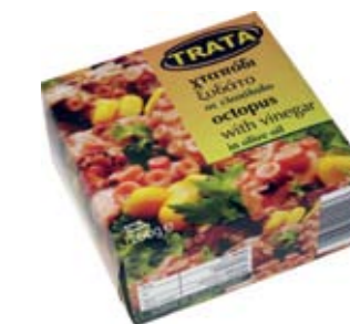
Χταπόδι ξυδάτο σε ελαιόλαδο Octopus with vinegar in olive oil