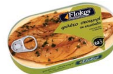
Φιλέτο σκουμπρι σε ελαιόλαδο Mackerel fillet in olive oil