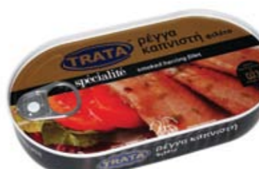
Φιλέτο ρέγγα καπνιστό σε φυτικό λάδι Smoked herring fillet in vegetable oil