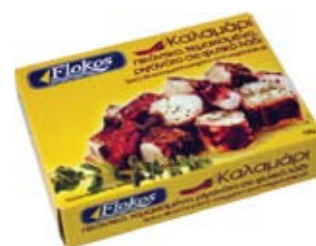
Καλαμάρι τεμαχισμένο, ριγανάτο, πικάντικο Spicy sliced squid in oregano