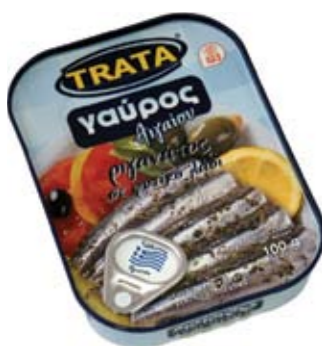
Γαύρος ριγανάτος Anchovy with oregano