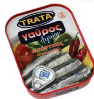
Γαύρος πικάντικος Anchovy piquant