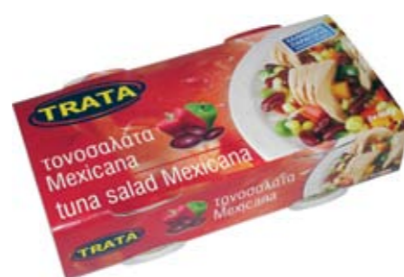
Τονοσαλάτα Mexicana Tuna salad Mexicana