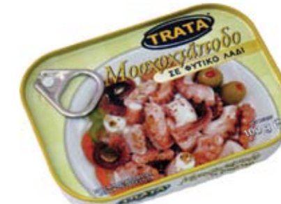
Μοσχοχτάποδο σε φυτικό λάδι Musky octopus in vegetable oil