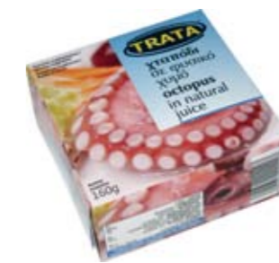
Χταπόδι σε νερό Octopus in water