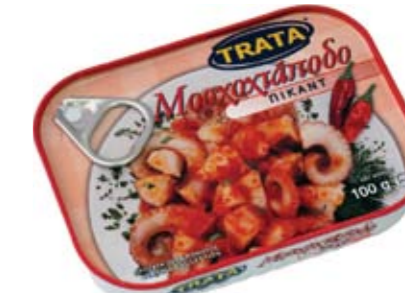
Μοσχοχτάποδο πικάντικο Musky octopus piquant