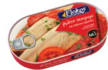
Φιλέτο σκουμπρι σε σάλτσα τομάτας Mackerel fillet in tomato sauce