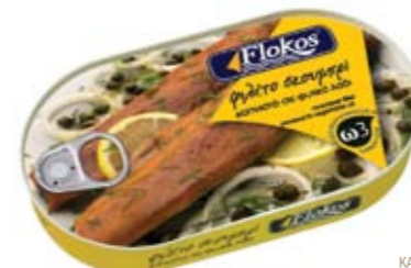
Φιλέτο σκουμπρι καπνιστό σε φυτικό λάδι Smoked mackerel fillet in vegetable oil