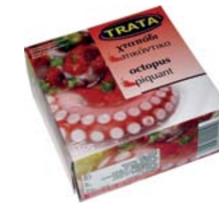
Χταπόδι πικάντικο Octopus piquant